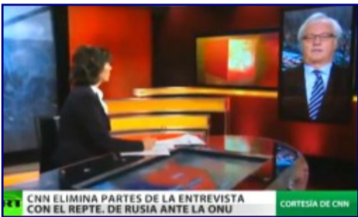
Noviembre 28, 2013 12:52 AM

CNN manipuló entrevista de embajador ruso en la ONU sobre Siria